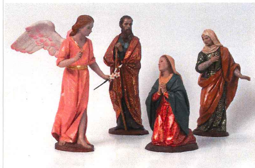
LA ANUNCIACIÓN A LA VIRGEN