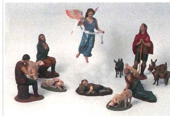
LA ANUNCIACIÓN A LOS PASTORES